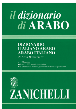
Eros Baldissera il dizionario di Arabo Dizionario Italiano-Arabo Arabo-Italiano 2004