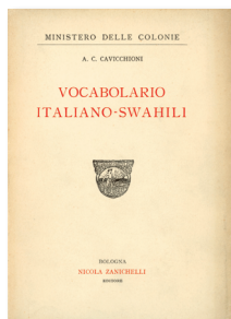
A. C. Cavicchioni Vocabolario Italiano-Swahili 1923