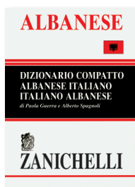
P. Guerra, A. Spagnoli Albanese Dizionario compatto Albanese-Italiano Italiano-Albanese 2005