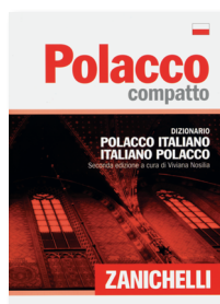
V. Nosilia Polacco Dizionario compatto Polacco-Italiano Italiano-Polacco 2007